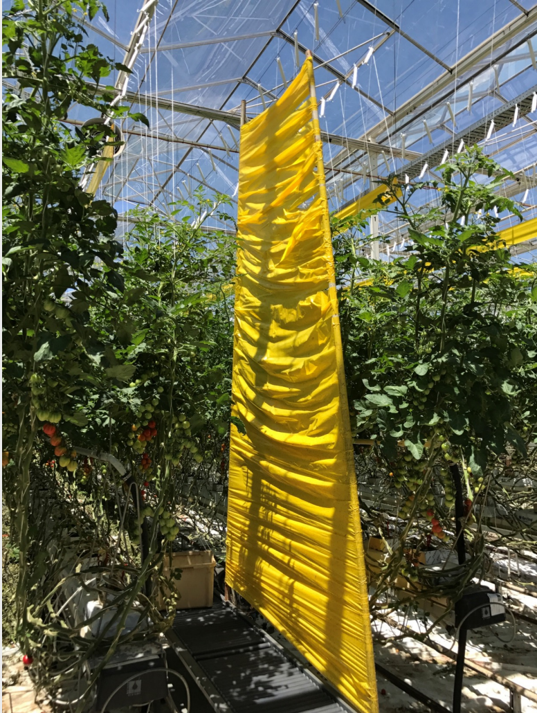
Opgesteld door Gilbert Heijens Horti-Cosnult International BV